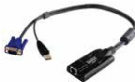
USB电脑端模块 KA7170 x 14